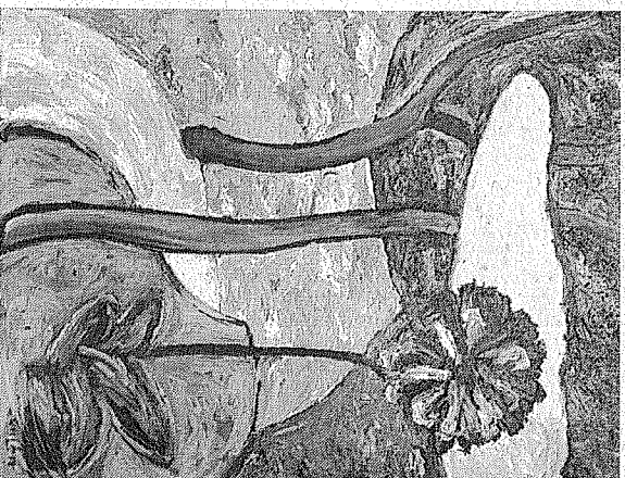
Una de las obras de la muestra.